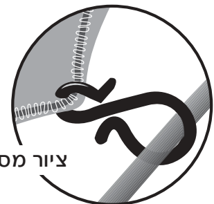
ציור מס' 1